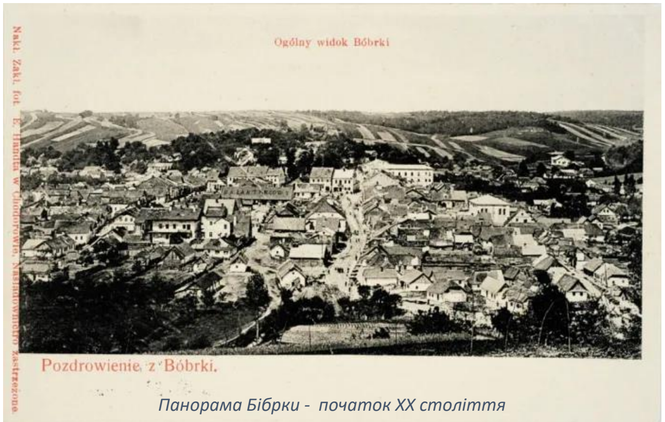
Панорама Бібрки - початок ХХ століття